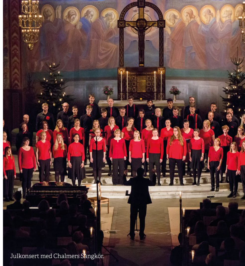
Julkonsert med Chalmers Sångkör.

– En annan fördel är att man lär känna varandra och får en bra connection när man arbetar och umgås tillsammans