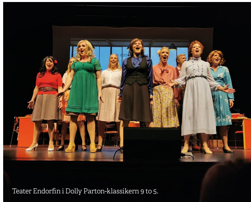
Teater Endorfin i Dolly Parton-klassikern 9 to 5.

– Vi är ofta 40–45 personer som arbetar med produktionerna, inklusive ljud- och ljusarbetare och musiker. Vi organiserar arbetet genom studiecirkel i till exempel dans, sång, kostym, scen-