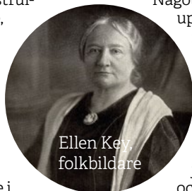
Ellen Key, folkbildare

”har folkbildning i blodet” och för sin förmåga att visa empati, respekt och lyhördhet för såväl deltagare som kollegor.