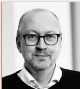
Stig-Olov Blixt Stiftelsesektor