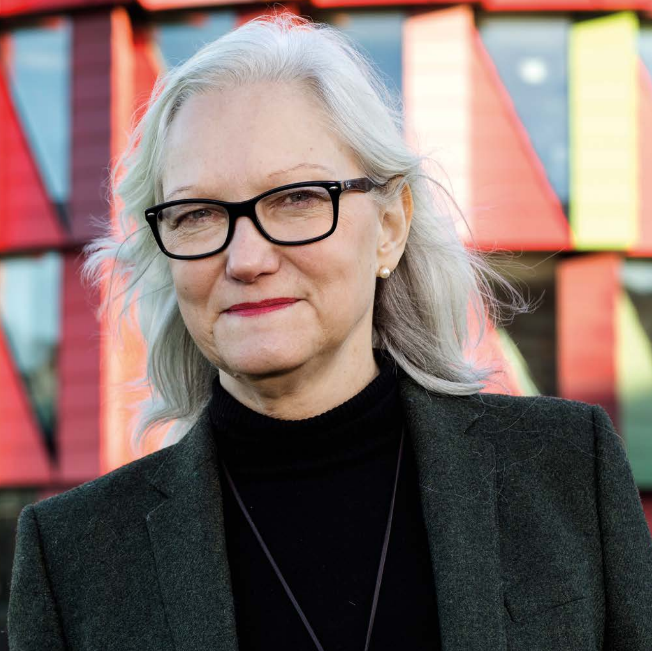
ur Ellen Key mitt i världen (Folkuniversitetets Akademiska Press)

"Ellen Key! Hon var kontroversiell men brann för folkbildningsidéerna och för att utforska vad det innebär att vara människa."