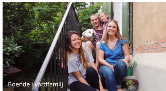
Boende i värdfamilj

Självständigt boende i studio för 1-2 personer med dusch, WC, kokvrå och TV. Det finns även studio med AC och tillgång till swimmingpool. Ca 15-20 minuters promenad från skolan.