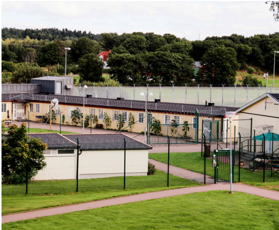
Anstalten i Skogome.