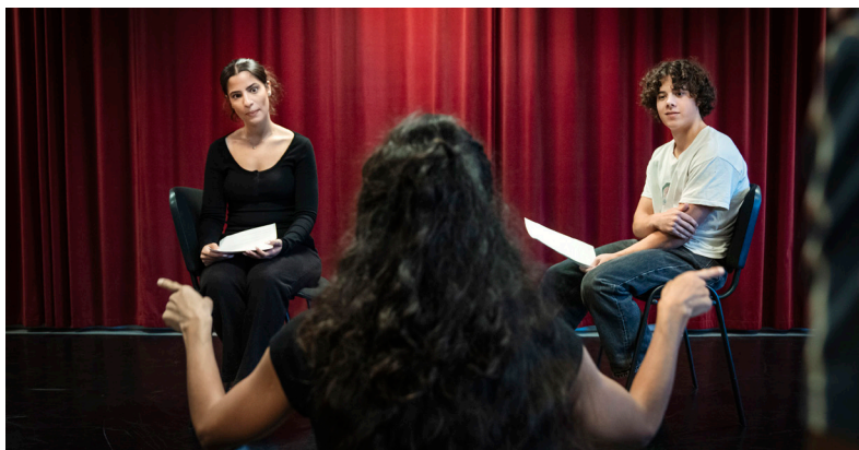
Deltagare från skådespelarlinjen.

Artemis dröm är att spela superhjärte, en komplex roll som kräver mycket teaterkunskap.